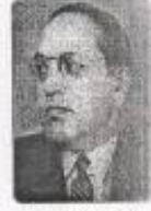
Dr. B.R. Ambedkar

Office: B-3/4, Sagar Apartments, Shahnoorwadi, Opp. Shahnoormiyan Durgah, Aurangabad- 431005 (MS) Ind., Ph.: 0240- 2320820